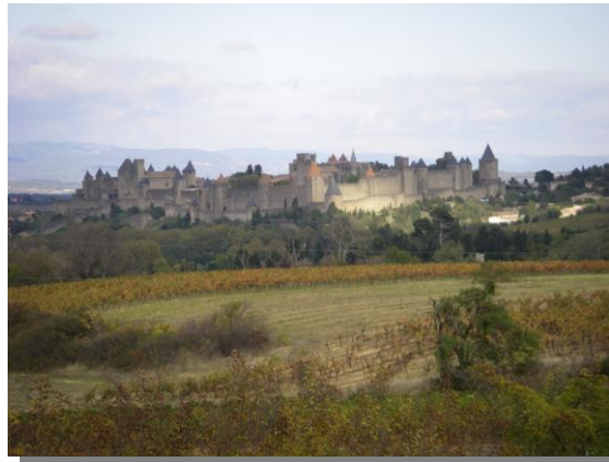
CARCASSONNE-CITÉ, DE OUDE KATHARENSTAD

De omgeving blijft ons verrassen alsmede de vele tientallen kleine dorpjes in de nabije omgeving. We hebben inmiddels ook ontdekt dat Résidence “A la Brayé” een ideale uitgangspunt is voor een tweedaags uitje in de cirkel van 300 km rondom het huis. Hierdoor zijn de Pyreneeën en andere mooie gebieden in kort bereik. Binnen twee uur is via de snelweg de mooie oude stad Carcassonne in de Midi-Pyreneeën te bezichtigen.