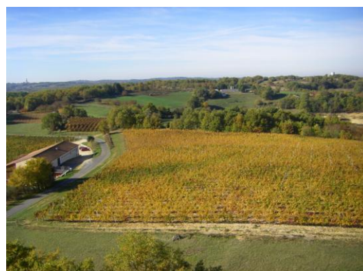
Uitzicht vanaf de uitkijktoren van Montcalou.